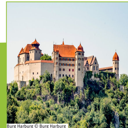
Burg Harburg