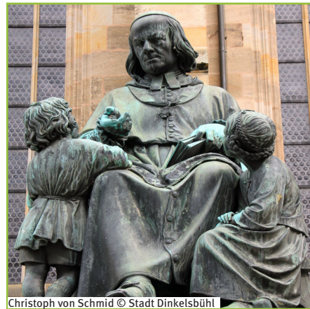
Christoph von Schmid © Stadt Dinkelsbühl

Die Stadt und die gesamte Romantische Straße ist ein beliebtes Ziel für Wanderer und Radfahrer, da sie von malerischen Landschaften und idyllischen Dörfern umgeben ist. Insgesamt ist Dinkelsbühl ein charmantes Reiseziel für Geschichts- und Naturliebhaber, die ihren Urlaub in einer angenehmen Mischung aus Entspannung und Unterhaltung vor Ort verbringen möchten.