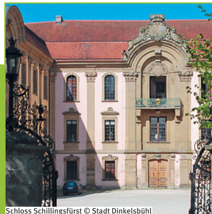
Schloss Schillingsfürst