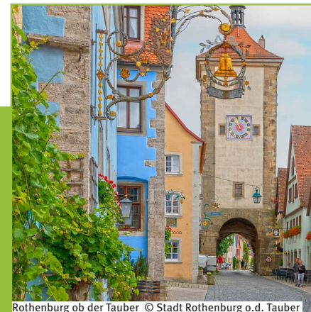
Rothenburg ob der Tauber