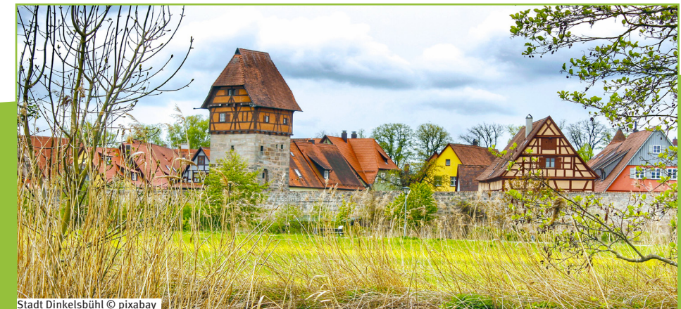
Stadt Dinkelsbühl