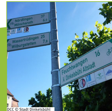
DCC © Stadt Dinkelsbühl