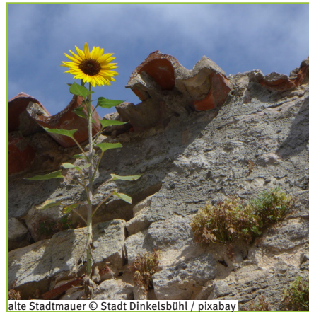
alte Stadtmauer