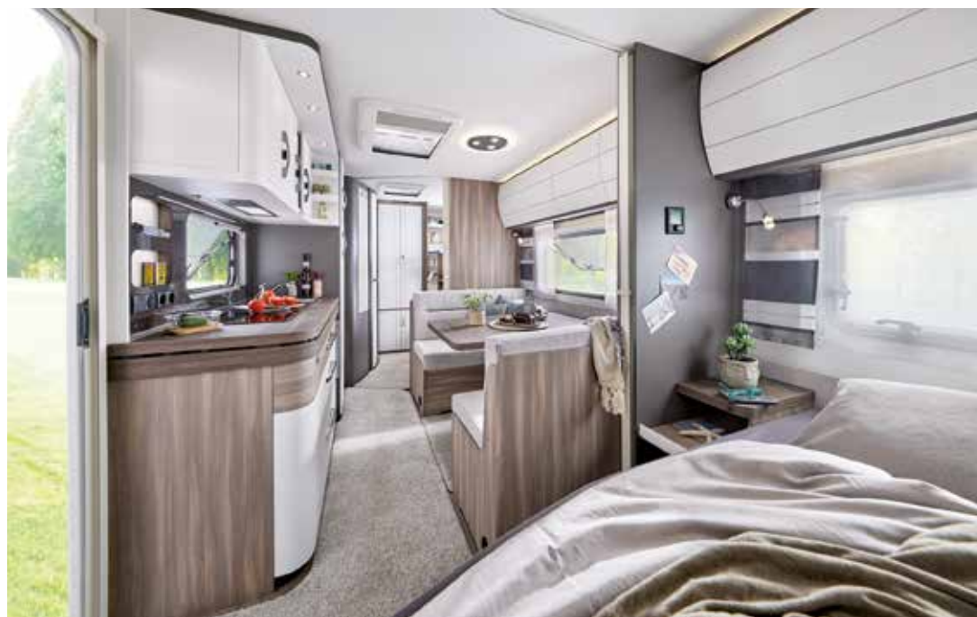
Der Blick vom Bug zum Heck verdeutlicht die Geräumigkeit und den modernen Einrichtungsstil

Die familienfreundliche Küche ist komplett bestückt und verfügt über viele Staumöglichkeiten