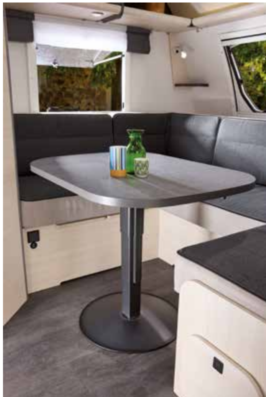
Alle Modelle mit Bugsitzgruppe erhalten einen variablen Hubsäulentisch

Text: Siegfried Semper, Fotos: Semper/Caravelair