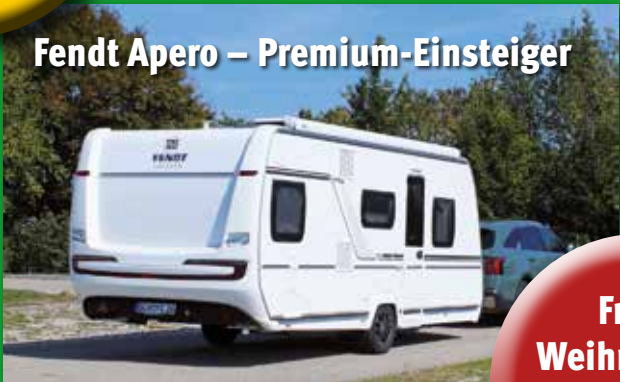
Fendt Apero – Premium-Einsteiger

Zu gewinnen: CMT-Eintrittskarten, Sound von Megasat, Wasserfilter von Lifestraw