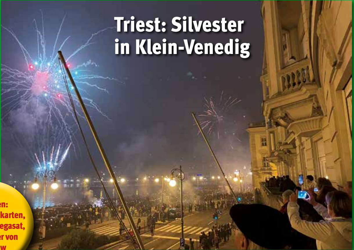
Triest: Silvester in Klein-Venedig

Zu gewinnen: CMT-Eintrittskarten, Sound von Megasat, Wasserfilter von Lifestraw