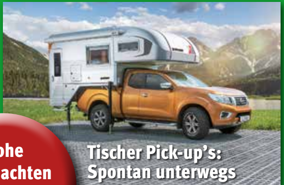
Tischer Pick-up's: Spontan unterwegs