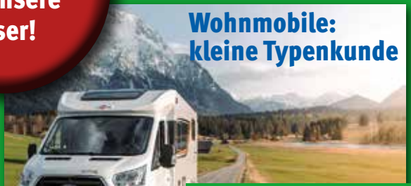
Wohnmobile: kleine Typenkunde