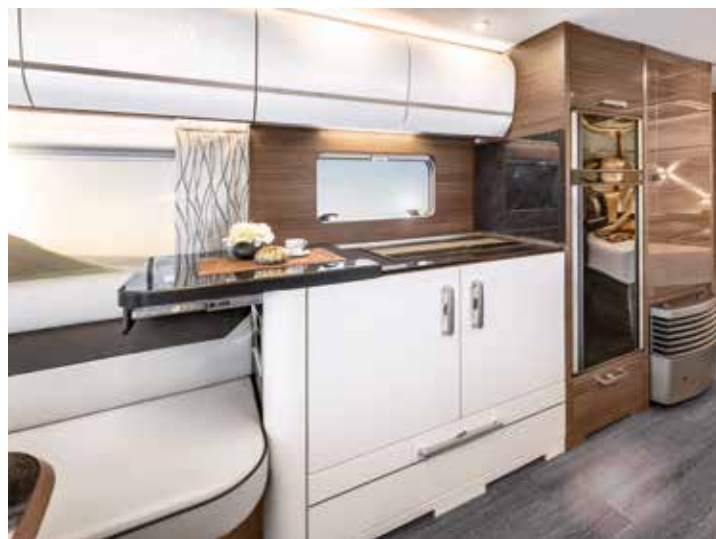
Clevere Küchenlösung: Ablagefläche oder komplette Küchenlandschaft