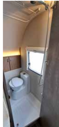
Im separaten Dusch- und Toilettenraum bleiben kaum Wünsche offen