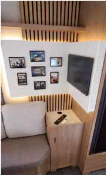
Design-Highlight mit Sprossenelement, Fotowand und TV-Fach