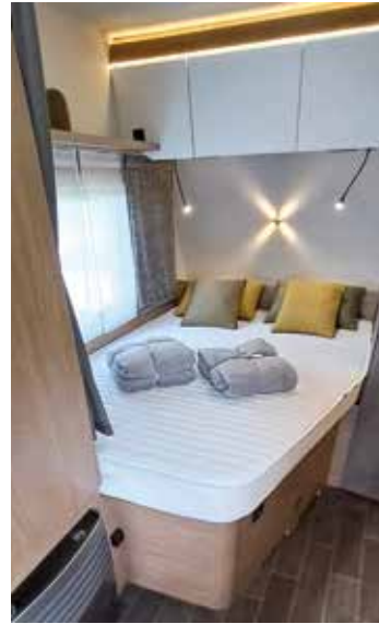
Das französische Bett im Bug glänzt mit komfortabler Kaltschaummatratze auf dem Holzlattenrost

wie die Seitenverkleidung auf der linken Seite mit offener Ablage, Sprossenelement, hinterleuchteter Fotowand und perfekt eingepasstem TV-Fach. Durch den freistehenden Klapp Tisch ist der bequeme Zugang zu allen Sitzplätzen gewährleistet.