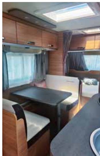
Gemütlich: CaraOne 480 QDK

Salon auf dem Weinsberg-Messestand in Halle 4. Selbstverständlich ist der Monoachser relativ komplett ausgestattet und bringt unter anderem einen 133 l-Kühlschrank mit, eine Isektenschutztür und das Wasserfiltersystem „bluuwater“. Passend ist auch die dimmbare Ambientebeleuchtung oder die Möglichkeit, auch hier - dann allerdings optional - die neue Cleanflex-Toilette einzubauen, die die Knaus-Tabbert-Gruppe in der kommenden Saison auf den Markt bringt. Weiteres Ausstattungsplus: Schwerlastkurbelstützen, die für besten Stand sorgen. Erste Infos zum Editionsmodell gibt es unter www.weinsberg.com und dann natürlich während des Caravan Salons in Düsseldorf.