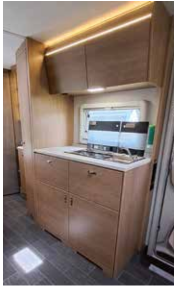
Gefällige Küche mit kompletter Bestückung, genug Stauraum und moderner Optik