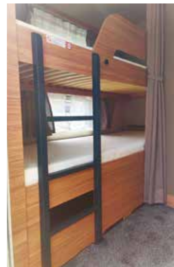
Eigenes Reich für den Nachwuchs