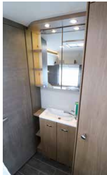
Genug Bewegungsfreiheit und reichlich Staumöglichkeiten bietet die offene Waschecke

Im nächsten Heft berichten wir aus der Reisemobil-Baureihe von Knaus